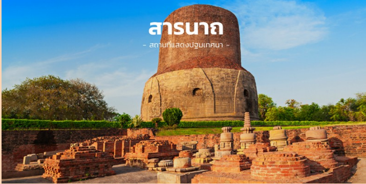
ສາຣນາຄ - ສາມາດແສດປຽບເທບ -