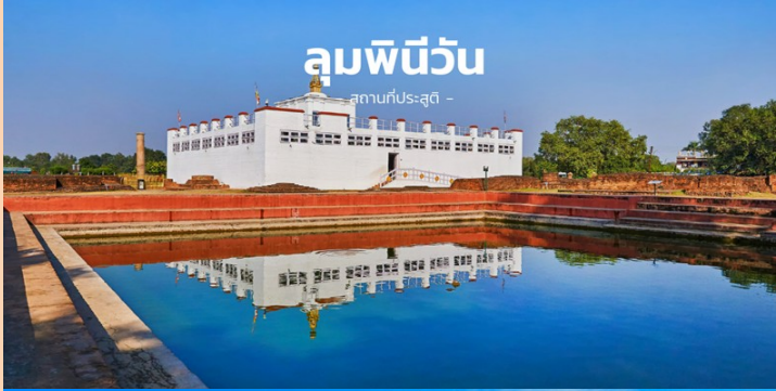
ລຸມພິນິວັນ - ສາມາດປະສູດ -