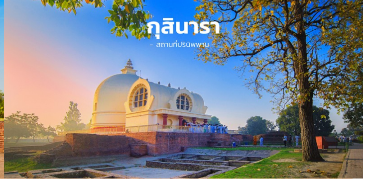
ກຸສິນາຣາ - ສາມາດປະສູດພານ -