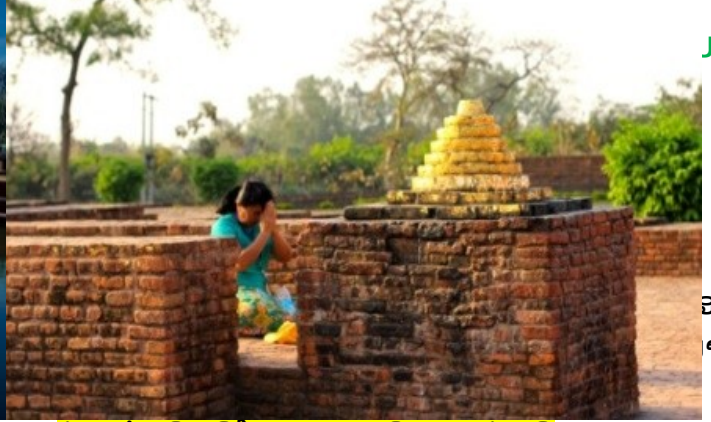
ຕອນຄ່ຳ : ເຊັ່ນຮັບປະທານອາຫານຄ່ຳທີ່ໂຮງແຮມ (13) ພັກຄ້າງຄົນທີ່ໂຮງແຮມ ເມືອງສາວັດຖີ