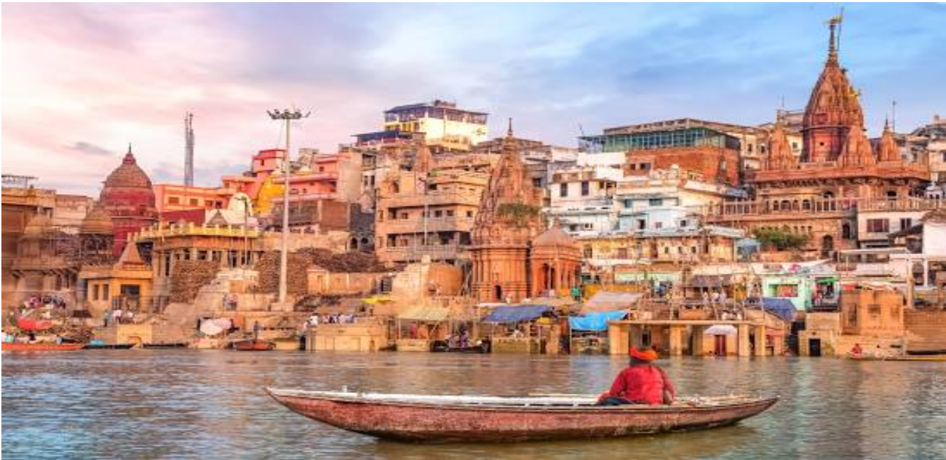
ຕອນຄ່ຳ : ຮັບປະທານອາຫານຄ່ຳທີ່ໂຮງແຮມ (16) ພັກທີ່ໂຮງແຮມ ເມືອງພາລານະສີ

ຕອນບ່າຍ : ນໍາພາທ່ານເດີນທາງສູ່ ເມືອງພາຣານະສີ ເມືອງຫລວງຂອງແຄ້ວນກາສີ ເປັນເມືອງທີ່ຈະເລີນຮຸ່ງເຮືອງຫຼາຍທີ່ສຸດແຫ່ງໜຶ່ງ ຕັ້ງແຕ່ສະໄໝກ່ອນພຸດທະການ. ນໍາພາທ່ານເດີນທາງໄປສູ່ເມືອງພາຣານະສີ (ໃຊ້ເວລາເດີນທາງ 8-9 ຊົ່ວໂມງ).