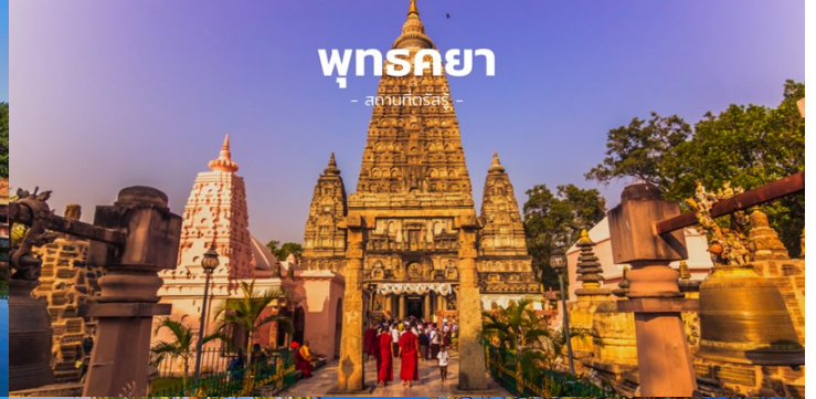
ພຸທຣາຍາ - ສາມາດຕັດສະຮູ້ -