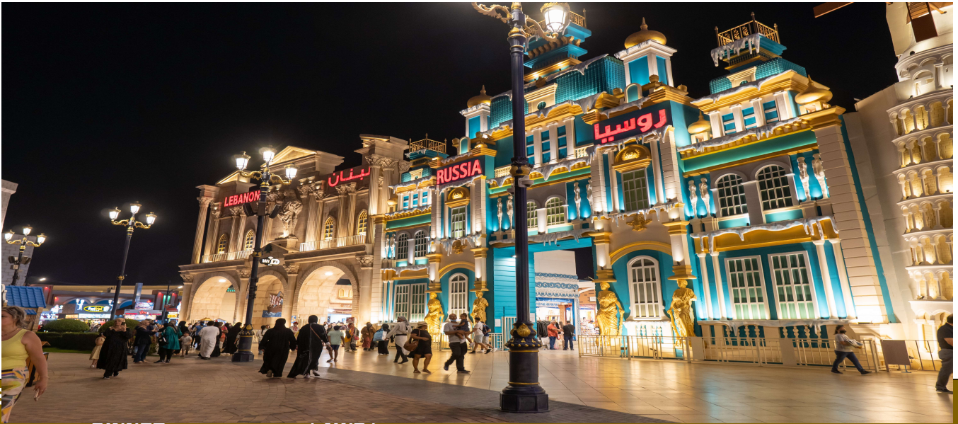
ມ້ທິ DINNER ທວທະເລລາຍ (4WD)