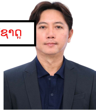
Scanned with CamScanner