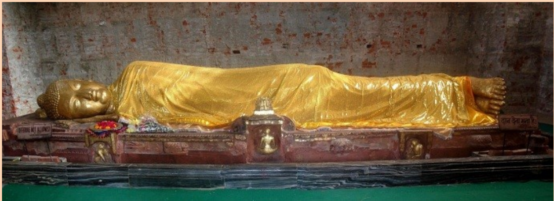
ທີ 5 ຂອງການເດີນທາງ : ລຸມພິນີ (ເນບານ) ທ່ຽວຊົມ ວິຫານມາຍາເທວີ - ສາວັດຖີ

*ກະລຸນານຳກຽມໜັງສືເດີນທາງຂອງທ່ານ ທີ່ດ່ານຊາຍແດນອື່ນເດຍ-ເນບານ*