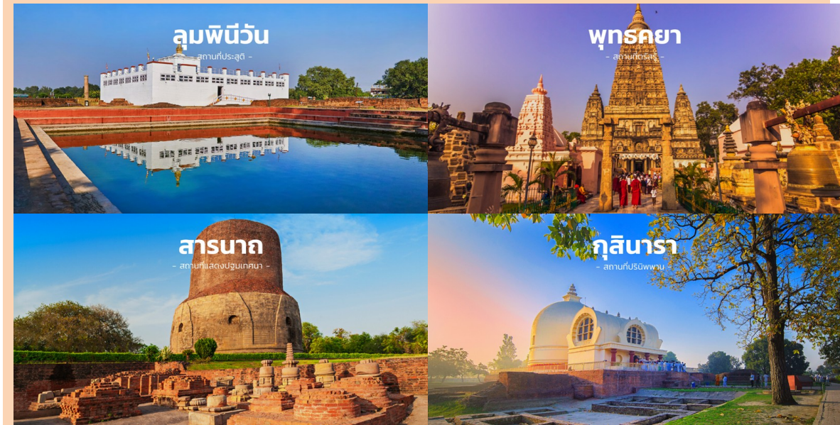
ມື້ທຳອິດ ຂອງການເດີນທາງ ກາງເທບ (ສຸວັນນະເພຼມ) – ພຸດທະຄະຍາ

09.30 ມ. ອອກເດີນທາງຜ່ອມກັນທີ່ ທ່າອາກາດສະຫຍາມນາງຊາດ ສຸວັນນະເພຼມ ອາຄານຜູ້ໄດຍສານລະຫວ່າງ ປະເທດ ຊັ້ນ 4