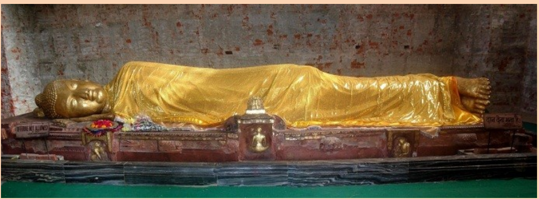
ທີ 5 ຂອງການເດີນທາງ : ລຸມພິນີ (ເນບານ) ທ່ຽວຊົມ ວິຫານມາຍາເທວີ - ສາວັດຖີ

*ກະລຸນານຳກຽມໜັງສືເດີນທາງຂອງທ່ານ ທີ່ດ່ານຊາຍແດນອິນເດຍ-ເນບານ*