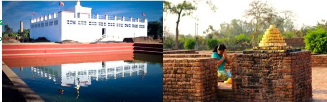
ຕອນຄ່າ : ເຊັນຮັບປະທານອາຫານຄ່າທີ່ໂຮງແຮມ (13) ພັກຄ້າງຄົນທີ່ໂຮງແຮມ ເມືອງສາວັດຖີ