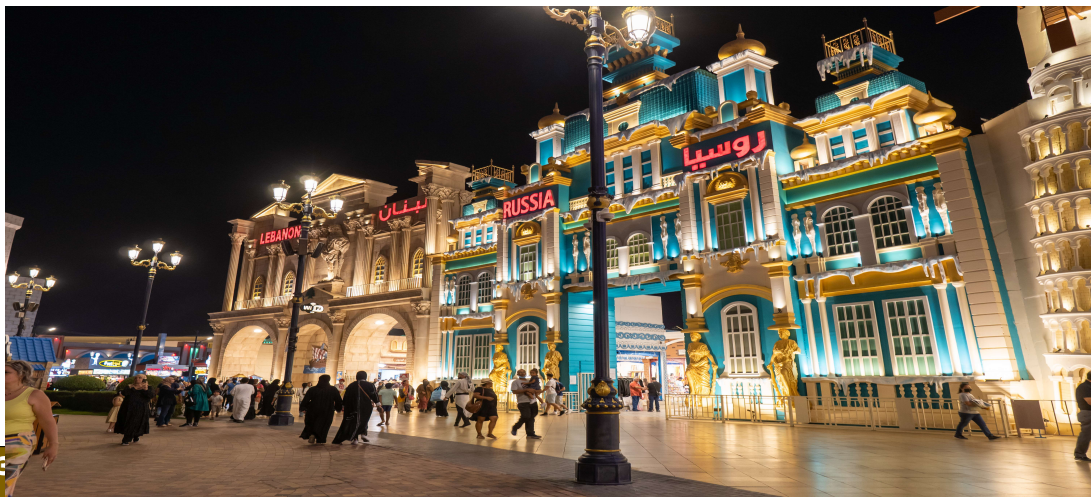
ມື້ທີ : DINNER ທວທະເລຊາຍ (4WD)

ແລງ ຮັບປະທານອາຫານແລງທີ່ຮ້ານອາຫານ CHINESE RESTAURANT ຈຳນວນຄະນະເດີນທາງໄປສູ່ພິພິກ CORAL DEIRA HOTEL ລະດັບ 4 ດາວ ຫຼື ຫຽບເທົ່າ