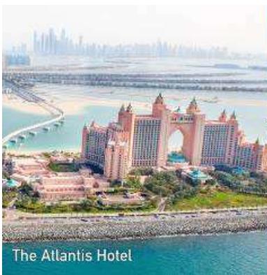
The Atlantis Hotel

ນຳທ່ານ ນັ່ງລົດໄຟ MONORAIL > ເດີນທາງສູ່ໂຄງການເຕີະປາມ THE PALM ເຊິ່ງເປັນໂຄງການທີ່ງົດງາມ ໂຄງການທີ່ດີທີ່ສຸດໂດຍ reclamation ທະເລ ມີ 3 ເກາະທຽມທີ່ສ້າງຂຶ້ນຕາມຮູບຂອງຕົ້ນປາມ, ເທິງ ເກາະມີໂຮງແຮມ, ລີສອດ, ຫ້ອງແຖວ, ຮ້ານຄ້າ, ຮ້ານອາຫານ, ແລະ ຫ້ອງການ ຖືວ່າເປັນສິ່ງ ມະຫັດສະຈັນອັນດັບ 8 ຂອງໂລກ