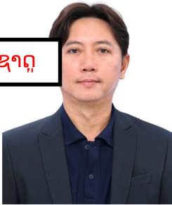
Scanned with CamScanner