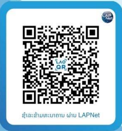
ຊໍາລະຂ້າມທະນາຄານ ຜ່ານ LAPNet