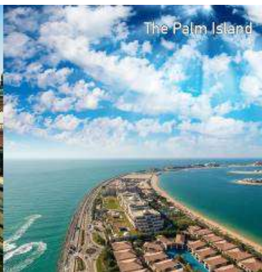
The Palm Island

ພາຄະນະໄປເບິ່ງຫາດຊາຍ JUMEIRAH BEACH ເຊິ່ງເປັນຮີສອດຫາດຊາຍທີ່ສວຍງາມ ທີ່ນິຍົມໃນ Dubai ຖ່າຍຮູບຢູ່ທີ່ຫາດຊາຍ ຈຸໂມໂອຣ ດູໄບ (AIN DUBAI WHEELS) ເຊິ່ງຈະເຂົ້າຮ່ວມລາຍຊື່ສະຖານທີ່ທ່ອງທ່ຽວທີ່ສວຍງາມຂອງໂລກທີ່ Dubai. ເປັນ ຊິງຊ້າສະຫວັນ Ferris ທີ່ໃຫຍ່ທີ່ສຸດ ແລະ ສູງທີ່ສຸດໃນໂລກ ຕັ້ງຢູ່ເທິງເກາະ Bluewater ໃກ້ກັບ Dubai Marina ດ້ວຍຄວາມສູງຂອງມັນຍາວ 250 ແມັດ, ມີຂາລີສູງ 126 ແມັດ, ຍາວພໍທີ່ຈະຮອງ ຮັບລົດເມລອນດອນໄດ້ເຖິງ 15 ຄັນ ໃນຂະນະທີ່ນ້ຳໜັກຂອງສູນກາງ ແລະ ການໝຸນແມ່ນທຽບກັບ ເຮືອບິນ A380 ປະມານ 4 ລຳ