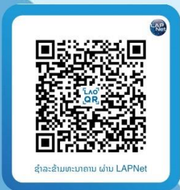
ຊຳລະຂ້າມທະນາຄານ ຜ່ານ LAPNet