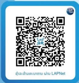
ຊໍາລະຂົນທະນາຄານ ຜ່ານ LAPNet