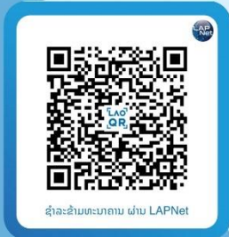
ຊໍາລະຂ້າມທະນາຄານ ຜ່ານ LAPNet